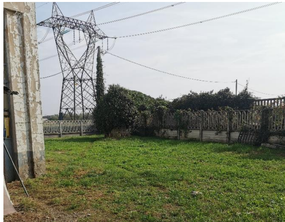
Fotografia n° 10