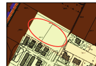
ESTRATTO PGT - Carta sensibilità paesistica, 1:2000