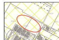
ESTRATTO FATTIBILITA' GEOLOGICA