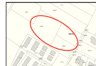
ESTRATTO MAPPA CATASTALE - scala 1:2000 foglio 104 - particelle 8830-8832-parziale 1882