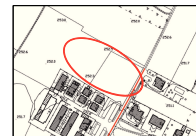
ESTRATTO sottoservizi_rete acqua potabile