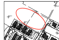
ESTRATTO AEROFOTOGRAFICO - 1:2000