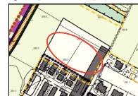
ESTRATTO PGT - Carta dei Vincoli, 1:2000