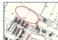
ESTRATTO sottoservizi_retefognaria pubblica