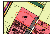
ESTRATTO AZIONAMENTO PGT - 1:2000