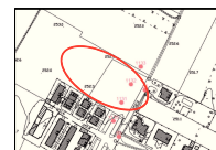
ESTRATTO sottoservizi_rete illuminazione pubblica