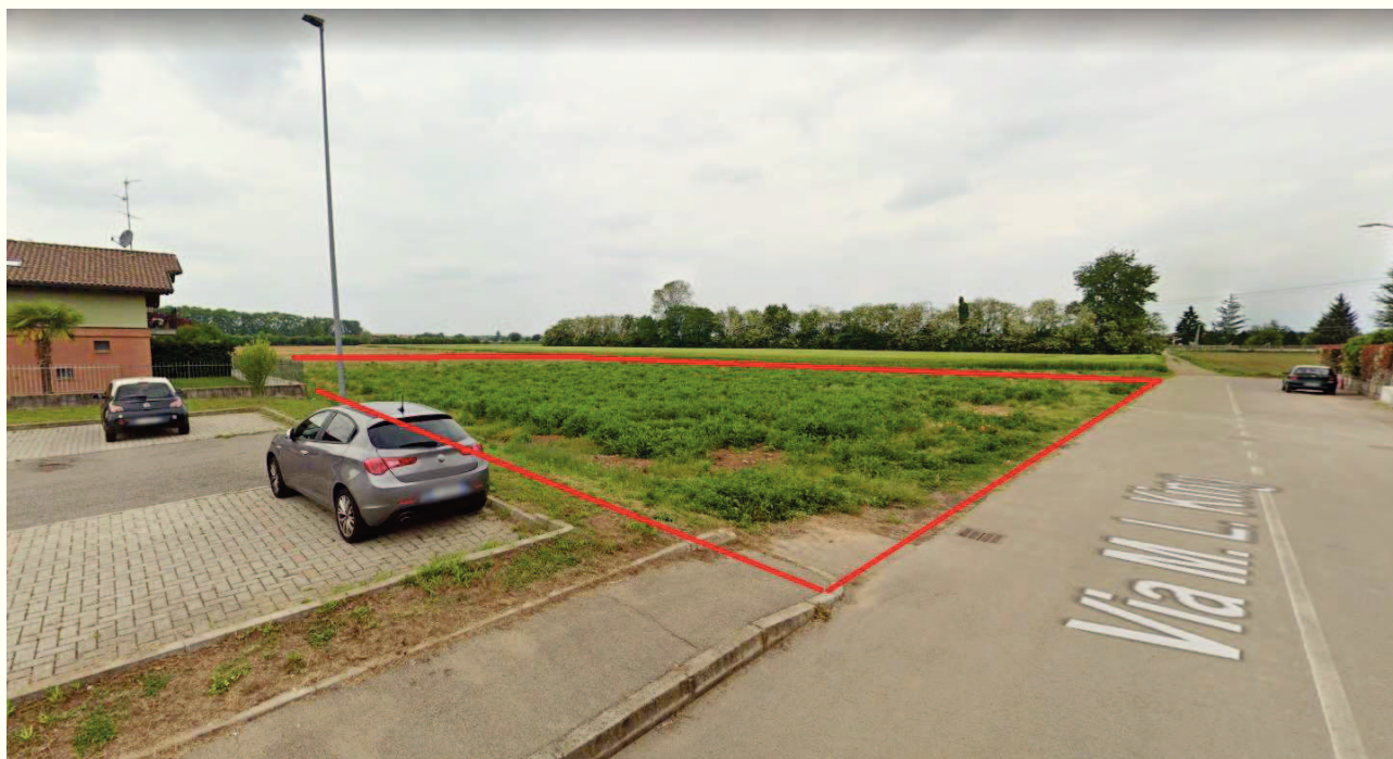
IMMAGINE 02 STATO DEI LUOGHI