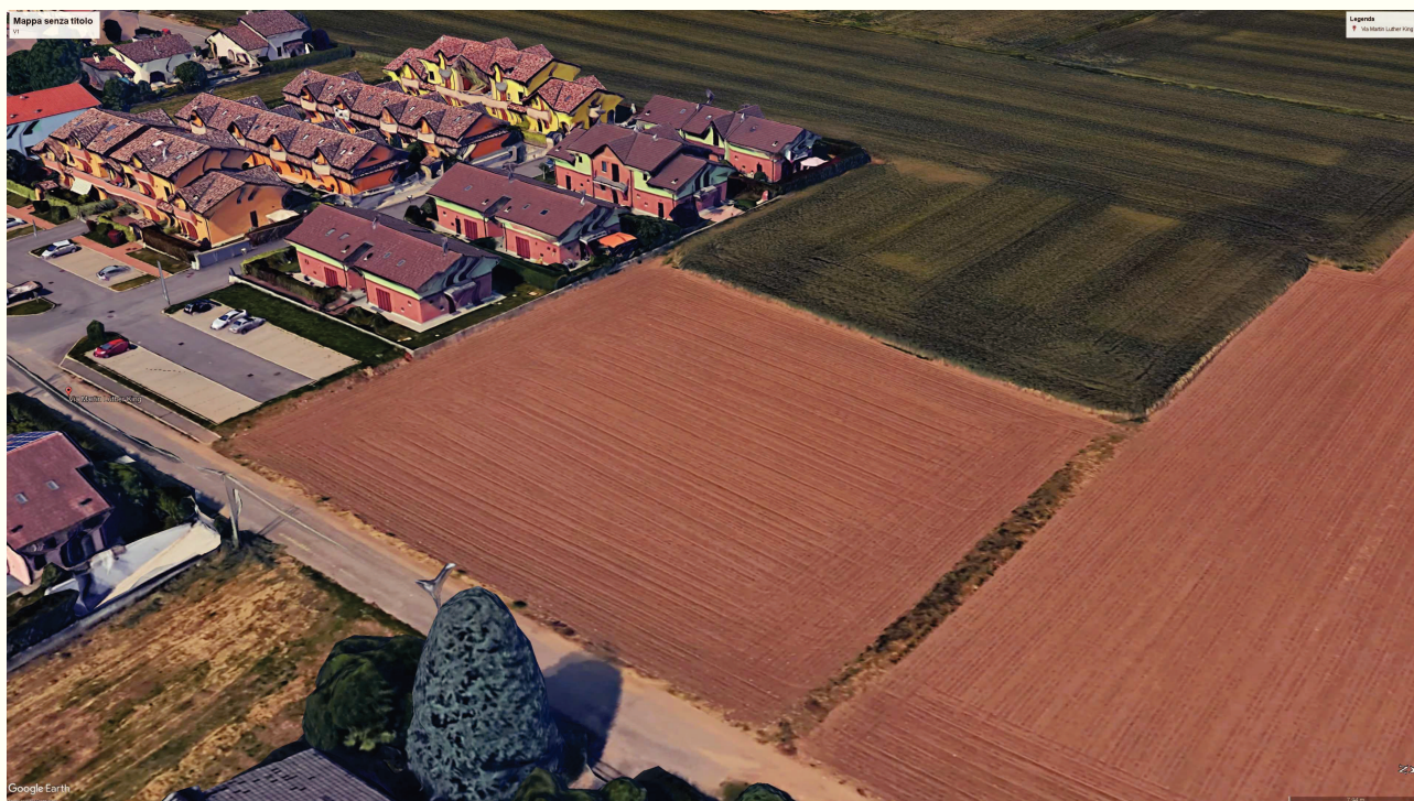
IMMAGINE 02 – ANTE INTERVENTO