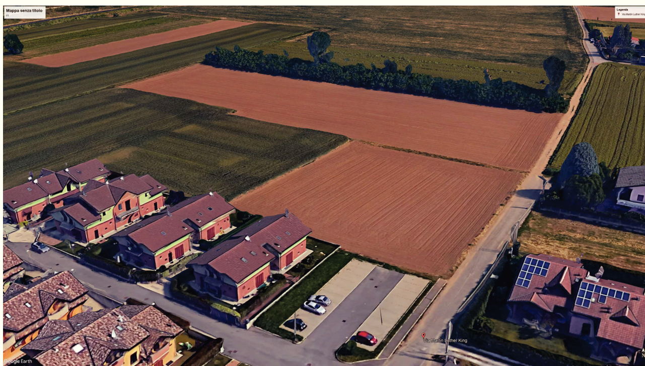
IMMAGINE 01 – ANTE INTERVENTO