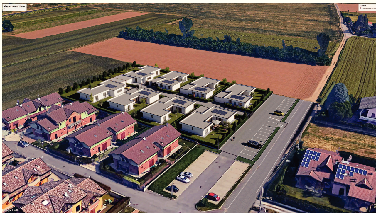
IMMAGINE 01 – POST INTERVENTO