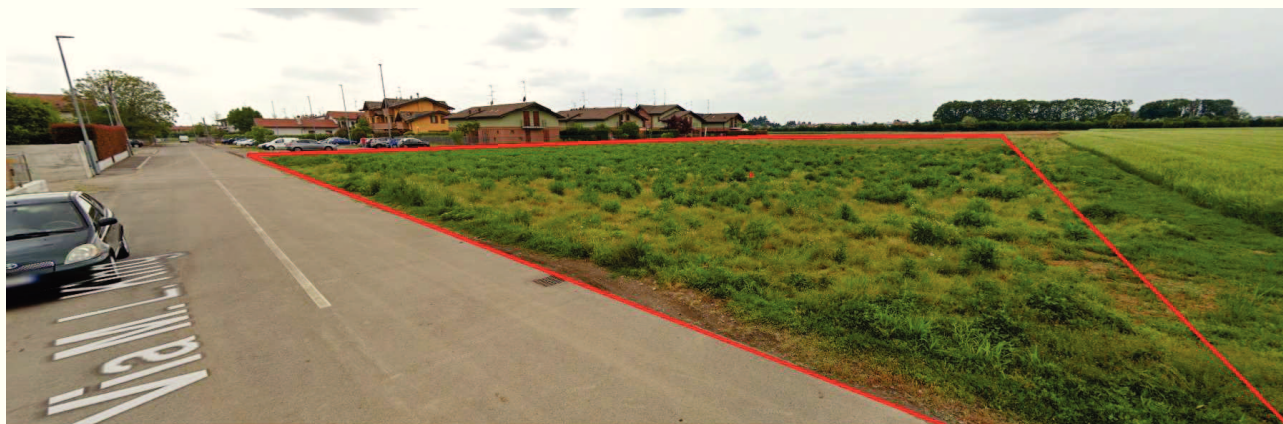
IMMAGINE 01 STATO DEI LUOGHI