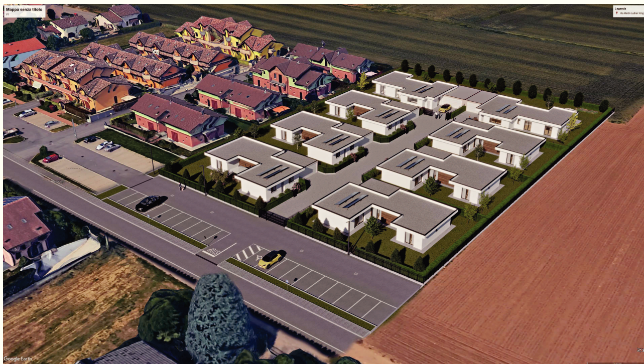
IMMAGINE 02 – POST INTERVENTO