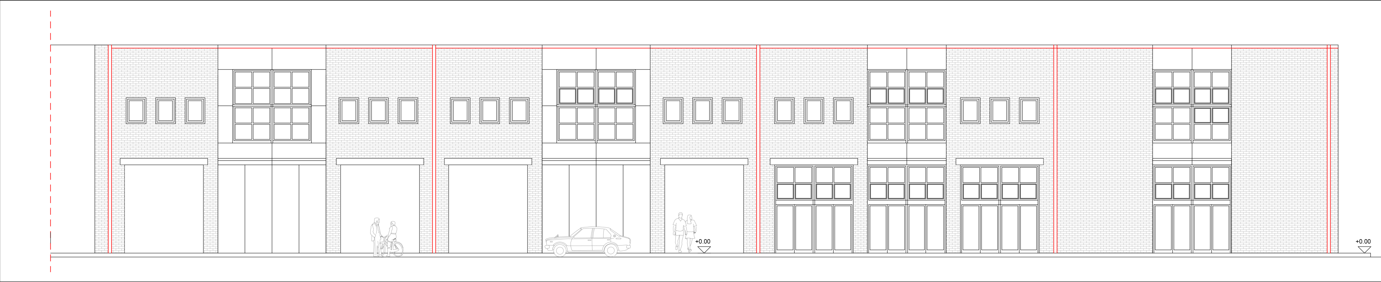
STATO DI FATTO: PROSPETTO OVEST scala 1:100