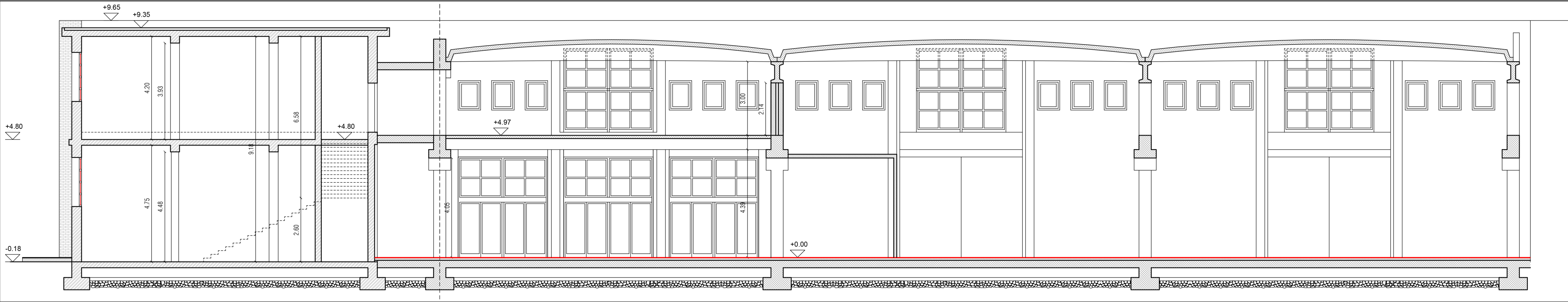
STATO DI FATTO: SEZIONE A-A' scala 1:100