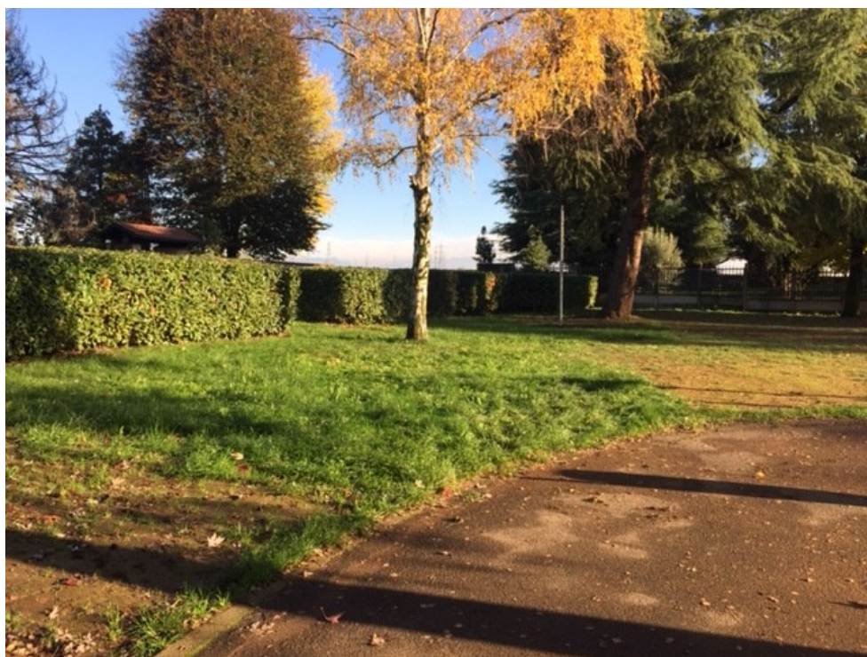
Nuova posizione area giochi nello stesso parco