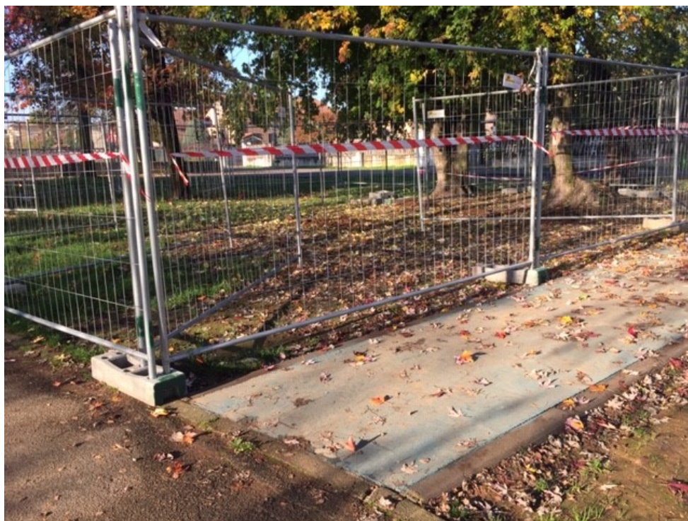
Posizione area giochi come da progetto esecutivo approvato